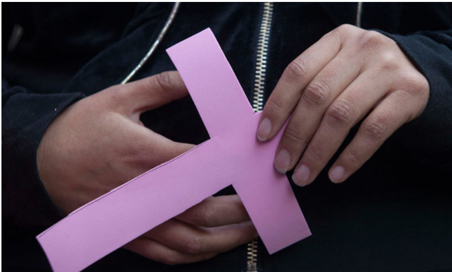
Mujeres protestan contra los feminicidios.

UBICACIÓN: Inicio » Estados » Feminicidios aumentan en seis estados con AVG