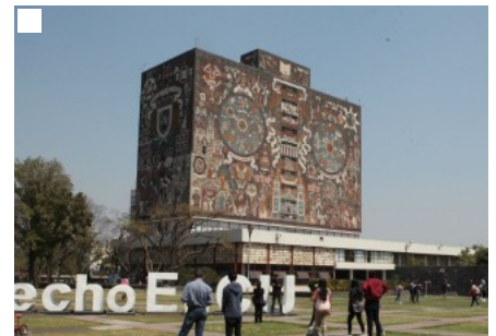
Más de tres mil alumnos de la UNAM cursaron estudios en el extranjero en 2018 - Proceso