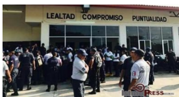
Encabezan paro de labores policías de