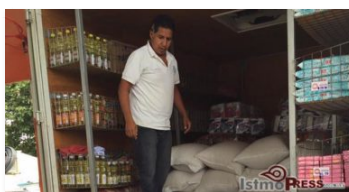
Con puente aéreo Diconsa inició