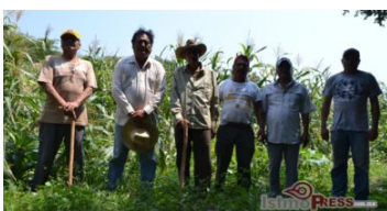
Campesinos zapotecas hacen frente a